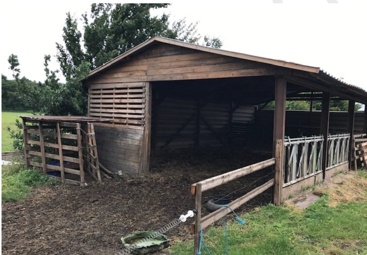
Foto af læskuret