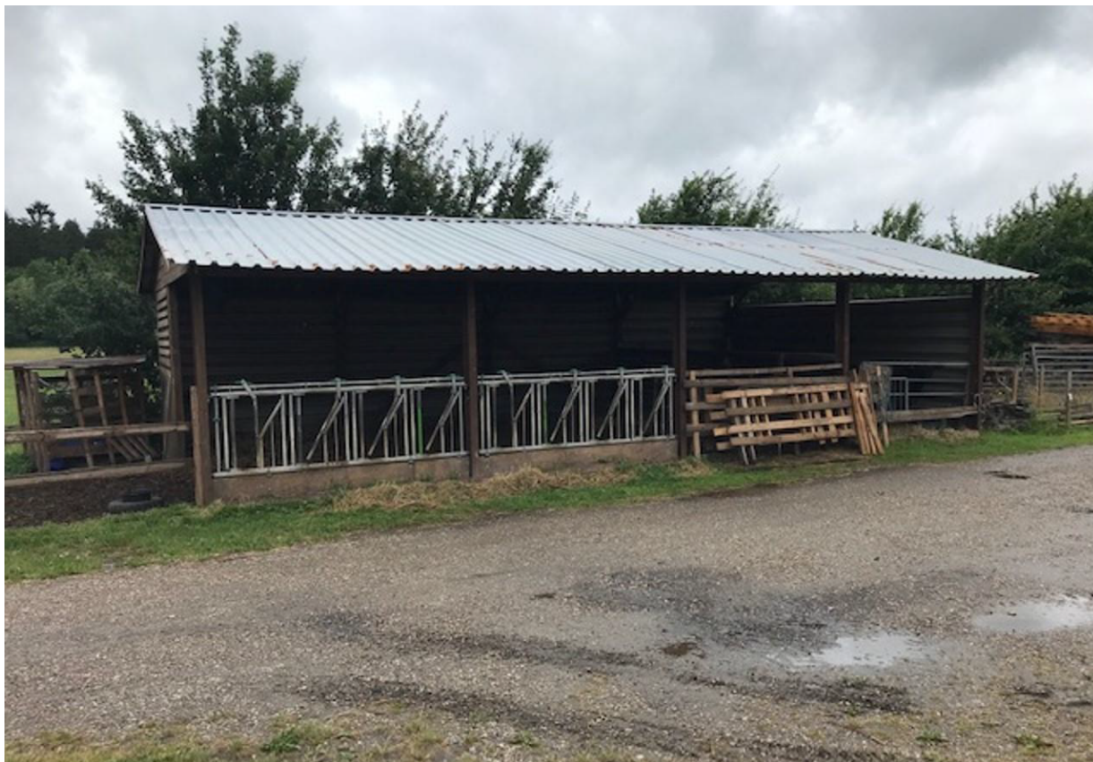
Foto af læskuret

Læskuret er opført vest for ejendommens bygninger på markareal. Der er pt. et dyrehold på 18 dyr på ejendommen.